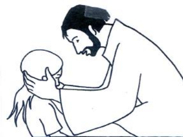
«Fanciulla, io ti dico: alzati!» Marco 5,41

Gesù nel vangelo guarisce due donne di età diversa. Un'adulta, sofferente da molti anni di perdite di sangue, e un'adolescente, l'ormai morente figlia di Giairo. In ambedue gli eventi è implicata la fede dei protagonisti: questa, nell'incontro con la vicinanza ospitale di Gesù, può crescere e diventare una vera esperienza di salvezza, oltre che miracolo di guarigione o di risurrezione.