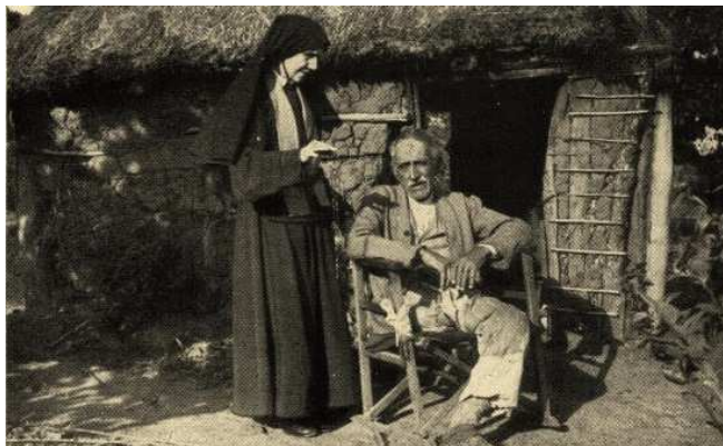
La M.° Fondatrice insegna a recitare il Rosario a un povero convertito.

“fare l'elemosina ai poveri è una delle principali testimonianze della carità fraterna; e pure una pratica della giustizia che piace a Dio”(da Il catechismo della Chiesa Cattolica)