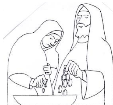
«Seduto di fronte al tesoro, osservava come la folla vi gettava monete» Marco 12,41

C'è nelle parole di Gesù una luminosa lezione di amore: imparare dai poveri, dagli umili, dai piccoli, che danno la vita come lui, secondo il «Vangelo di Dio».